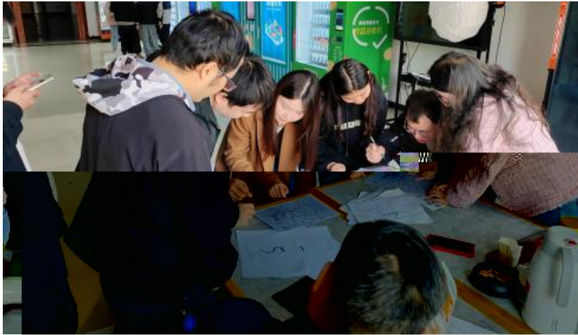
图 卓越团队建设共识营